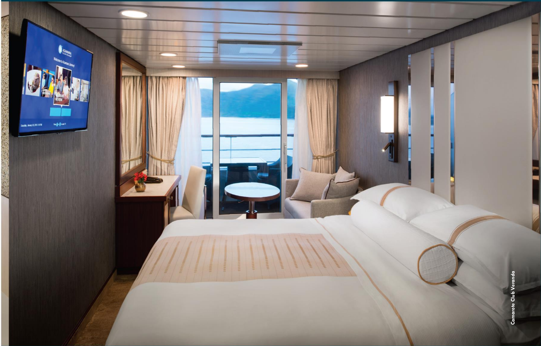
Camarote Club Veranda