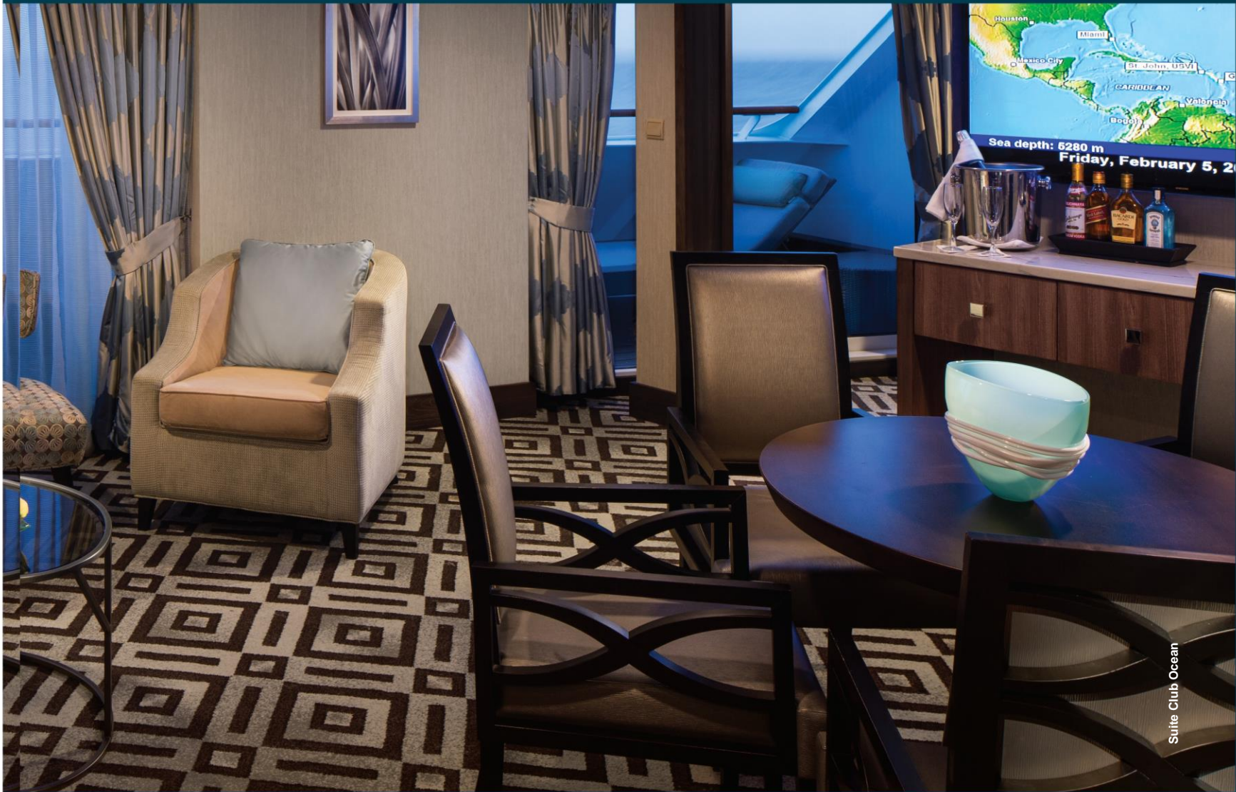
Suite Club Ocean