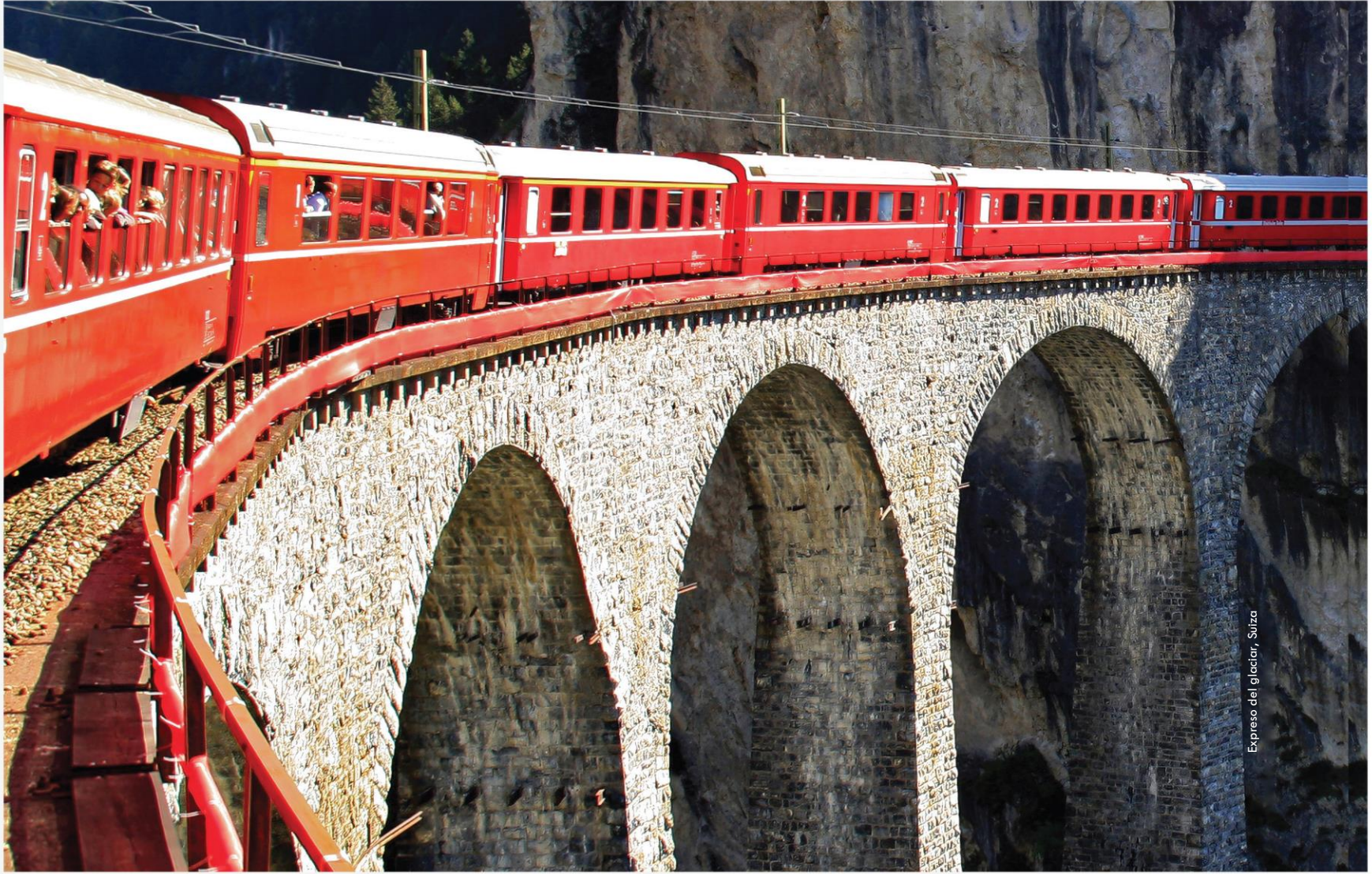
Expreso del glaciar, Suiza