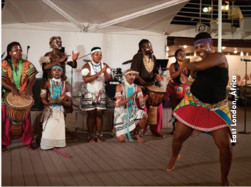
East London, Africa